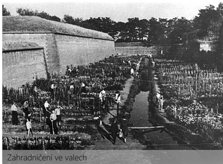
Zahradničení ve valech

Jídlo se stalo v Terezíně neoficiálním platidlem, krajíc chleba se vyvažoval zlatými prsteny či náušnicemi.