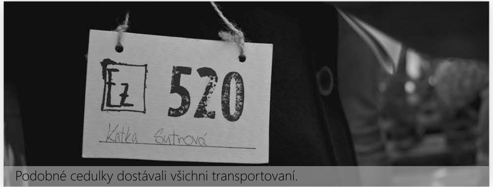
Podobné cedulky dostávali všichni transportovaní.

Každý, kdo byl úřady prohlášen za Žida, mohl kdykoli skončit na seznamu lidí, kteří půjdou do transportu do Terezína. Mohli si sbalit nejvýše 50 kg zavazadel, všechno ostatní museli nechat doma. O tom, kam jedou se mnoho nevědělo, ale paradoxně byl Terezín nejsvobodnějším místem v protektorátu - to, co bylo možné říkat či psát v ghettu, by se jinde tvrdě trestalo.