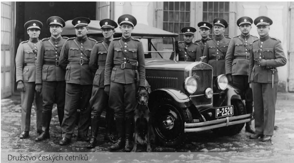
Družstvo českých četníků

Nacistické velení přikázalo hlídat Židy v Terezíně českým četníkům. Ti mnohdy uvězněným Židům pomáhali – zvláště s posíláním pošty příbuzným atd. Jednotky SS sice byly ve městě také, ale spíše dohlížely na to, jak vše funguje. Židé se v Terezíně mohli pohybovat většinou volně, ale nesměli ho opouštět.