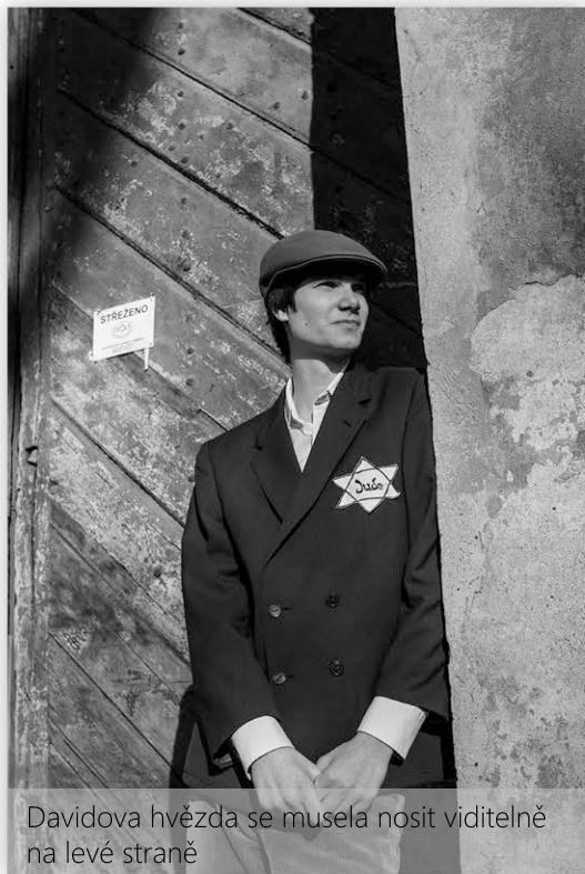
Davidova hvězda se musela nosit viditelně na levé straně

V roce 1939 obsadili nacisté Československo. Židé začali být stále více omezováni – byl jim zabavován majetek, museli na oděvu nosit žlutou látkovou hvězdu s nápisem Jude (žid), mohli chodit nakupovat jen ve vymezený čas, nesměli chodit do kin, divadel, parků, děti nesměly chodit do školy s ostatními. Postupně byli vyčleněni z normálního života.