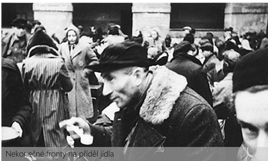
Nekonečné fronty na přiděl jídla

Jídla byl nedostatek. Většinou byly vodnaté polévky a nekvalitní chléb, margarín a občas kolečko salámu nebo brambory ve slupce. Nebylo moc cukru ani žádné sladkosti. Naštěstí z kohoutků tekla pitná voda. Děti dostávaly trochu lepší stravu, nejhůře trpěli staří lidé. Nicméně v každých podmínkách se lidé dokázali přizpůsobit – někdy nebyl problém udělat z chleba dort k narozeninám či našlehat trochu mléka s cukrem a udělat sladkou pěnu pro děti.