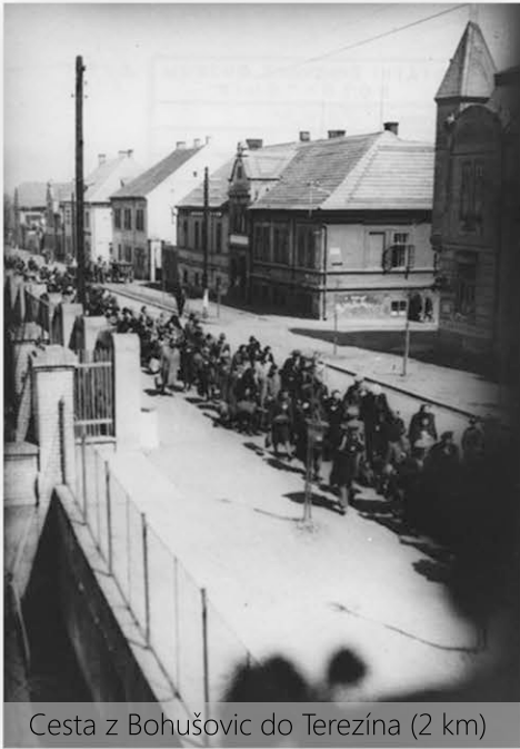
Cesta z Bohušovic do Terezína (2 km)